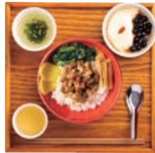
ルーロー飯セット