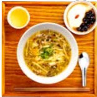
サンラータン麺セット