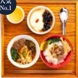
台湾満足セット 持ち帰り不可