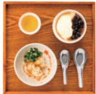
台湾豆乳スープセット