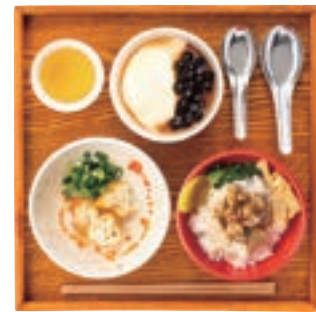
台湾朝食セット 持ち帰り不可