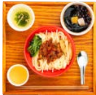
ルーロー乾麺セット