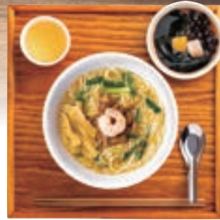
鶏ガラ坦々麺セット