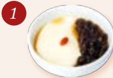
アンニトーファー 杏仁豆花