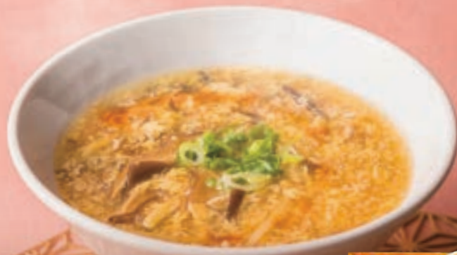
サンラータン麺セット