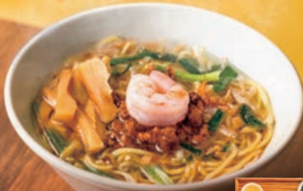
鶏ガラ坦々麺セット