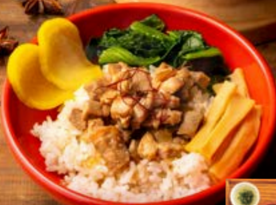
ルーロー飯セット