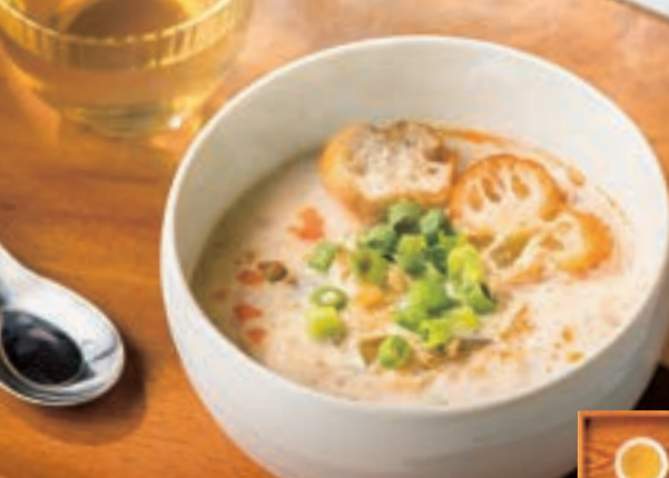
台湾豆乳スープセット